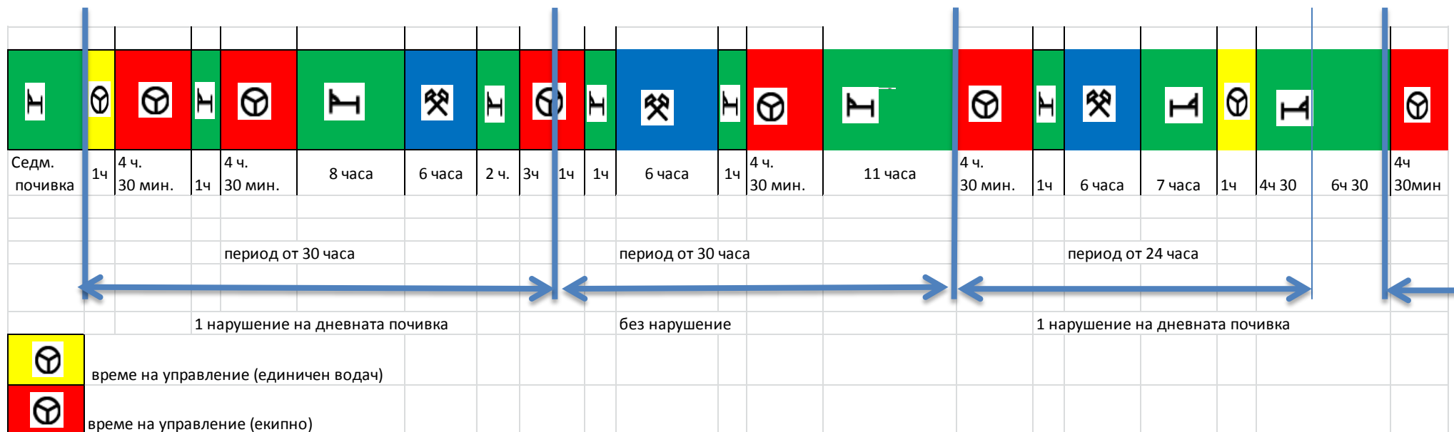
Пример 5: екипно управление

Горните примери служат само за онагледяване на начина, по който въз основа на базов период от 24 часа могат да бъдат разкрити нарушенията на разпоредбата за дневната почивка.