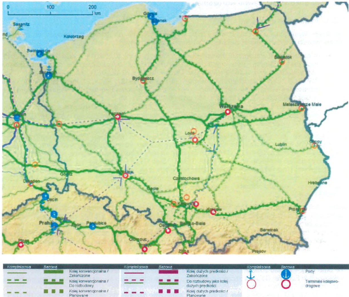
Rys. 2. Mapa kolejowej sieci TEN-T w Polsce dla pociągów towarowych